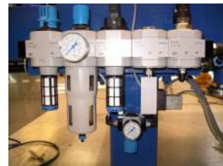
Detalle del sistema de filtrado y control neumático

Esquema y medidas básicas del equipo R-SIM1600 Separador de Metales por Detección Inductiva y Soplado , de ancho útil 1600 mm.